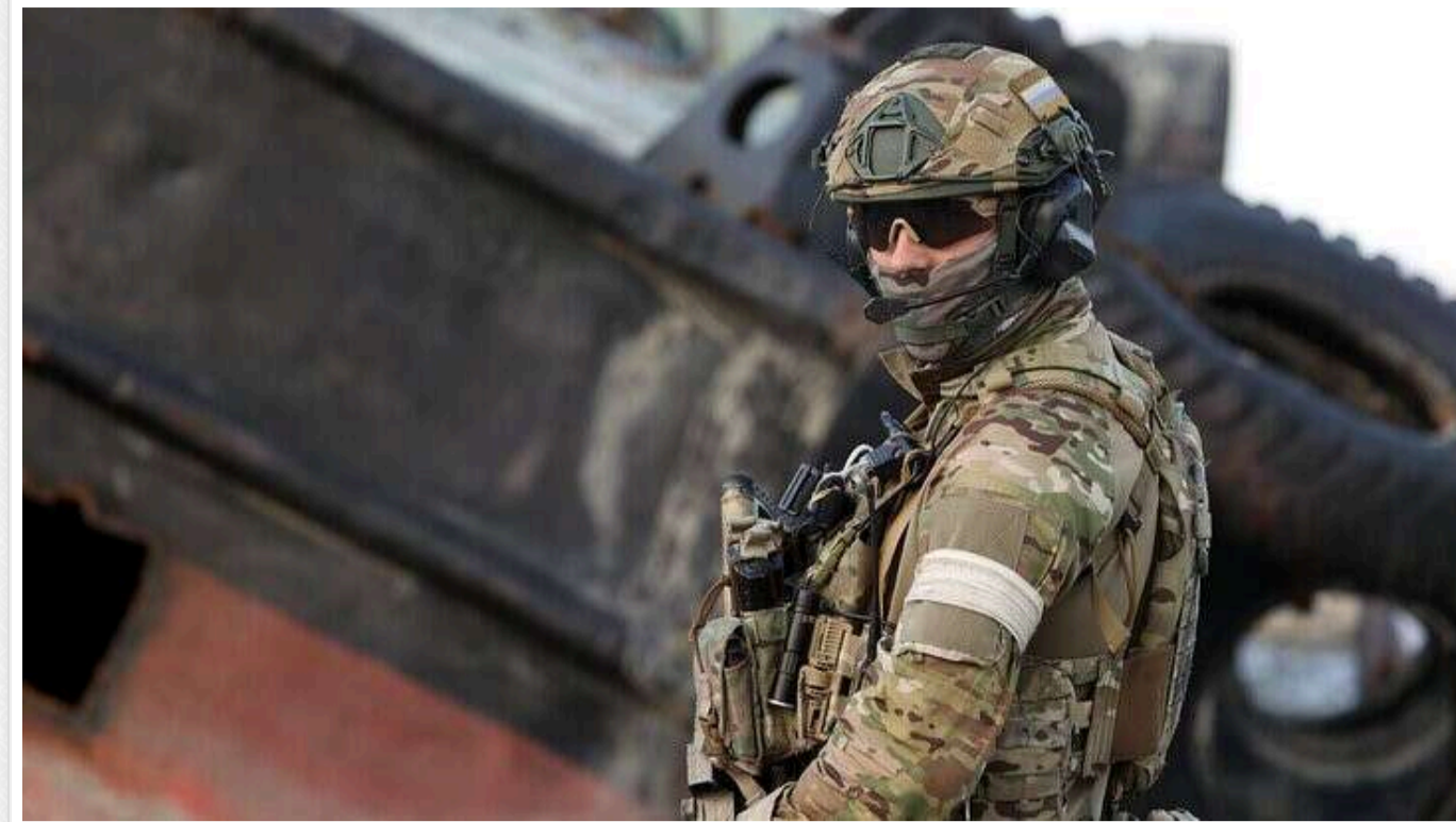
У Латвії засудили чоловіка, який воював в Україні в складі російської армії: отримав 6 років в'язниці

Громадянина Латвії, затриманого восени 2024 року за незаконну участь у війні в Україні на боці РФ та незаконний перетин зовнішнього кордону країни, засудили до позбавлення волі на шість років.