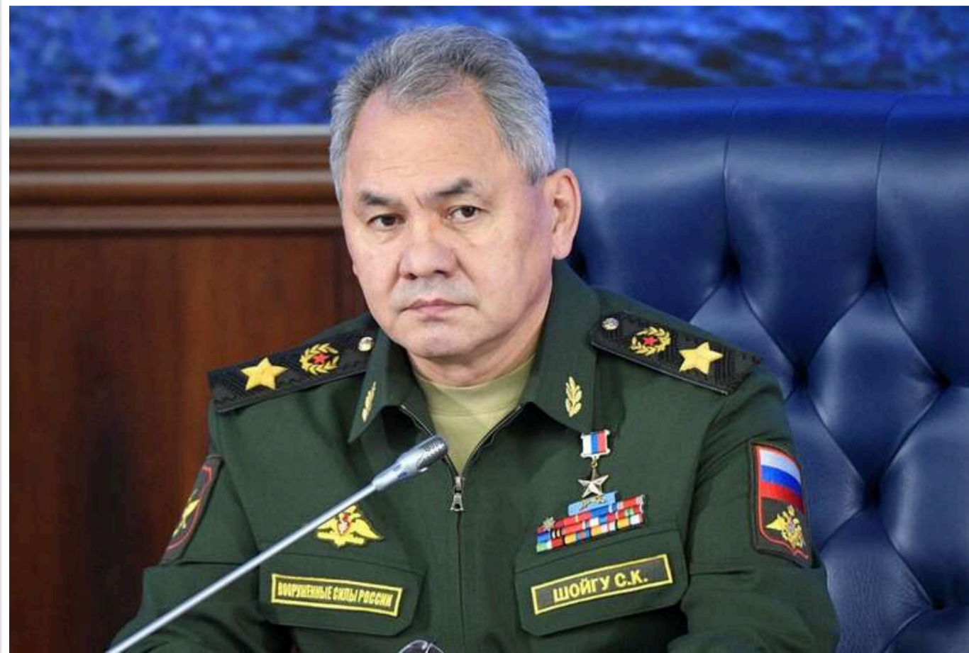
Шойгу заявив, що Європа вже готується окупувати захід України

Колишній міністр оборони РФ, секретар Радбезу РФ Сергій Шойгу заявив, що введення миротворчих сил в Україну під егідою "коаліції охочих" може призвести до Третьої світової війни.