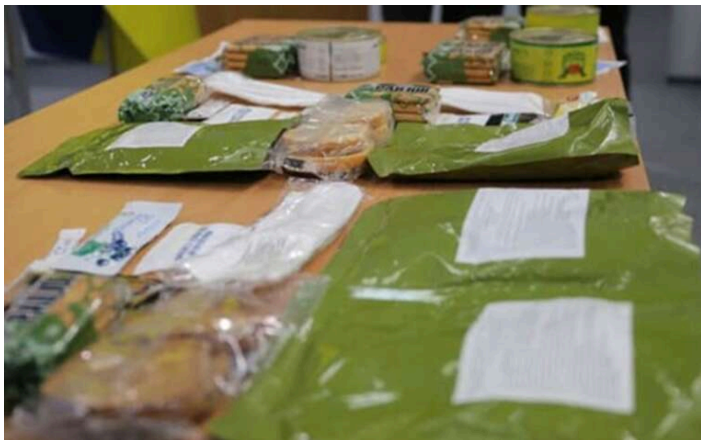
У ЗСУ з'являться халяльні та кошерні сухпайки, - Міноборони

Читати на руском Read in English Додати як бажане джерело в Google