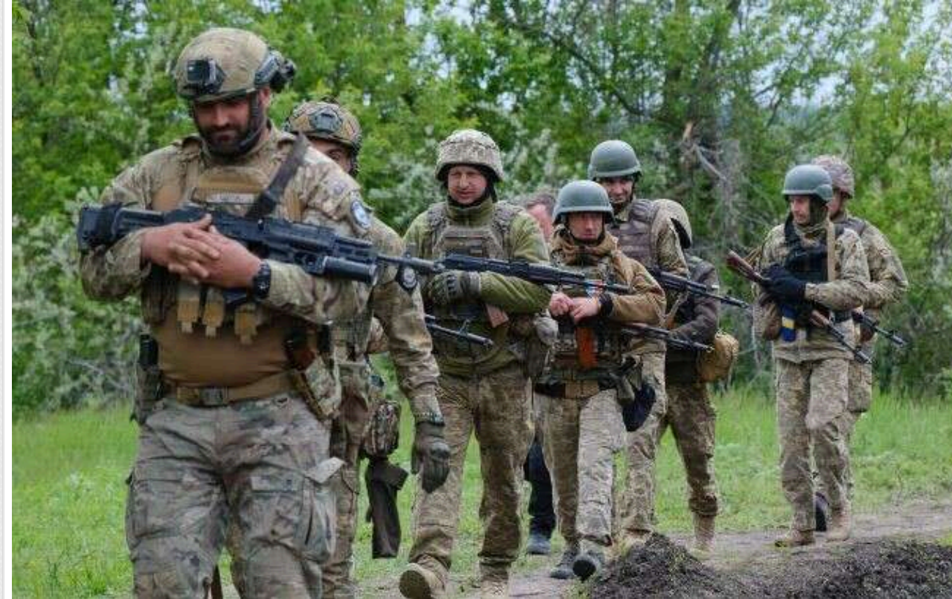
ISW: Сили оборони України просунулися на Курщині

Сили оборони України нещодавно просунулися в Курській області Росії. Це може свідчити про розширення тактичних дій ЗСУ на території РФ.