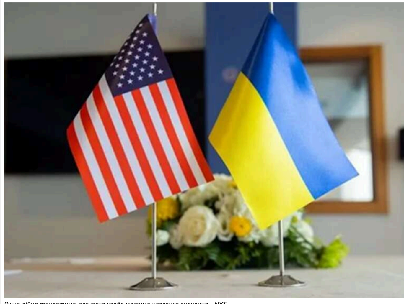
Якщо війна триватиме, ресурсна угода матиме невелике значення, - NYT

Наразі неясно, яке значення матиме підписана напередодні інвестиційна угода між Україною та США для майбутньої американської військової підтримки України. Однак, незважаючи на всі заяви, її значення буде обмеженим, якщо конфлікт між Україною та Росією продовжиться, зазначає The New York Times.