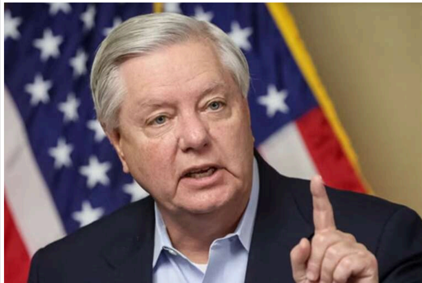
Bloomberg: Ліндсі Грем запропонував запровадити 500% мита на імпорт із країн, які купують в РФ енергоносії та уран

Сенатор-республіканець Ліндсі Грем висуває законопроект про санкції проти Росії, який, серед іншого, передбачає 500% мита на імпорт із країн, що купують російську нафту, нафтопродукти, природний газ або уран, повідомляє Bloomberg.