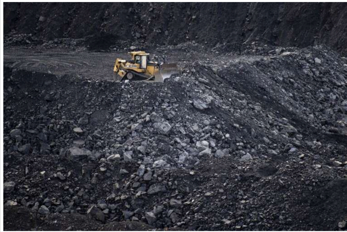
Підписана зі США угода стосується 57 мінералів: в ній ідеться про військову допомогу США

Угода між урядами США та України "про створення Американсько-українського інвестиційного фонду відбудови" залишає недеталізованою низку важливих положень двосторонньої співпраці й фіксує передусім базові, політичні параметри.