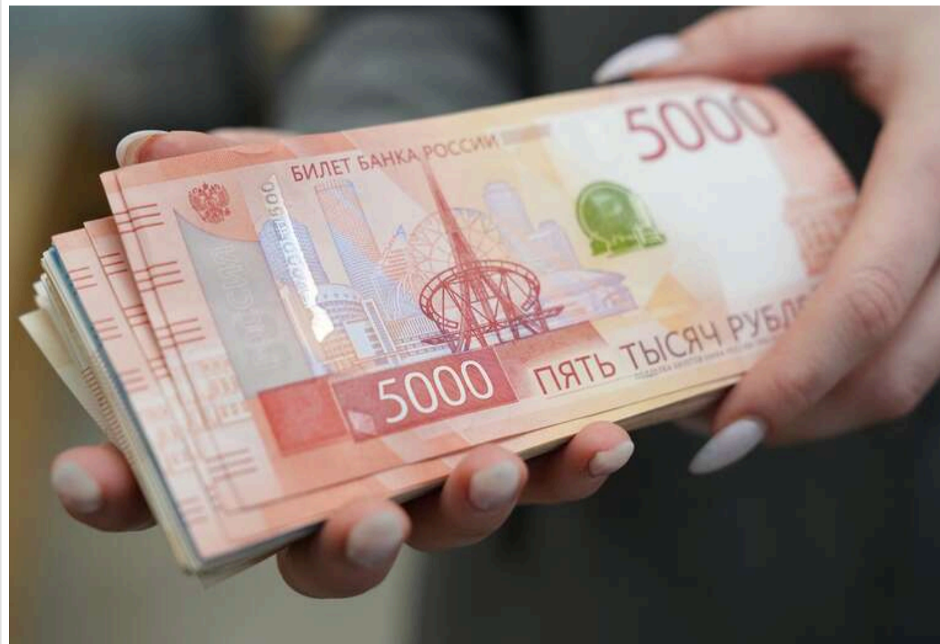
Мінфін Росії втричі підвищив прогноз дефіциту бюджету через падіння цін на нафту

Внаслідок зниження цін на нафту Міністерство фінансів Росії більш ніж втричі збільшило прогнозований дефіцит бюджету цього року - з 0,5% ВВП до 1,7% ВВП.