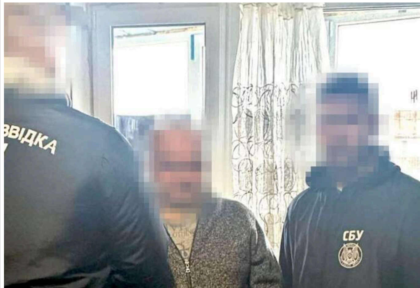
СБУ затримала залізничника, який коригував авіаудари РФ по Харківщині

СБУ викрила ще одного агента російського ГРУ, який працював на залізниці та шпигував за ешелонами ЗСУ.