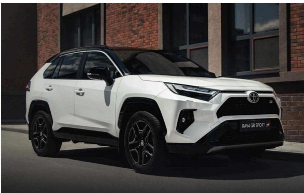
Серед нових легкових авто лідером ринку гібридів залишається TOYOTA RAV-4

Серед нових легкових авто лідером ринку гібридів залишається TOYOTA RAV-4 (166 од.) Другий результат у TOYOTA Yaris Cross (123 од.) Третій за популярністю - NISSAN X-Trail (121 од.)