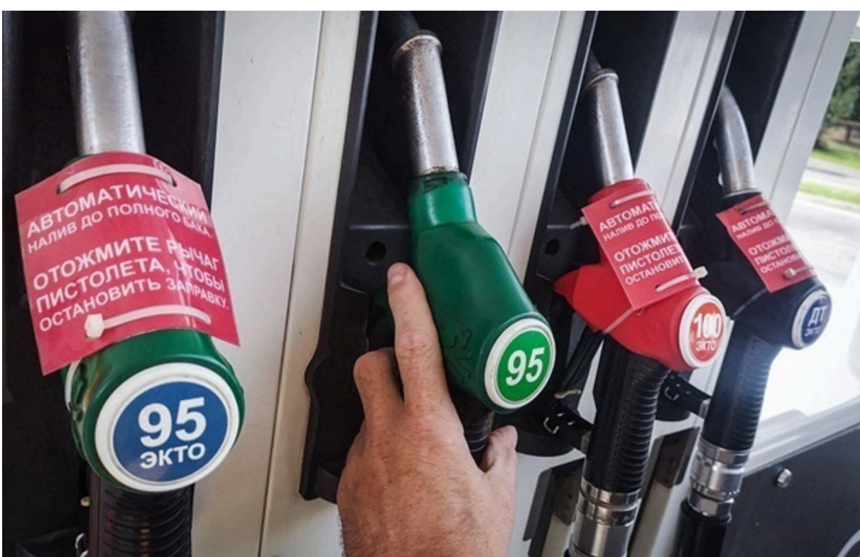
У РФ стрімко зросли ціни на бензин

Середня вартість палива на російських автозаправних станціях за тиждень із 2 по 8 червня збільшилася на 0,9%.