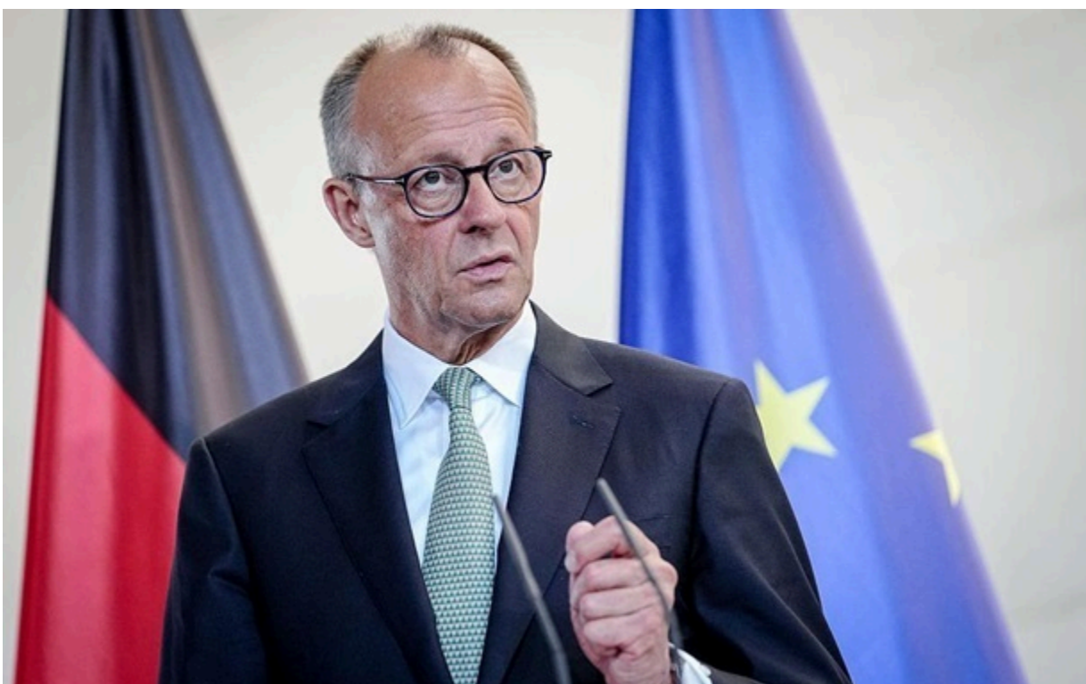
Канцлер ФРН Фрідріх Мерц

Оцінюючи євроінтеграційний трек України, канцлер зазначив, що країна досягла помітного прогресу на шляху реформ.