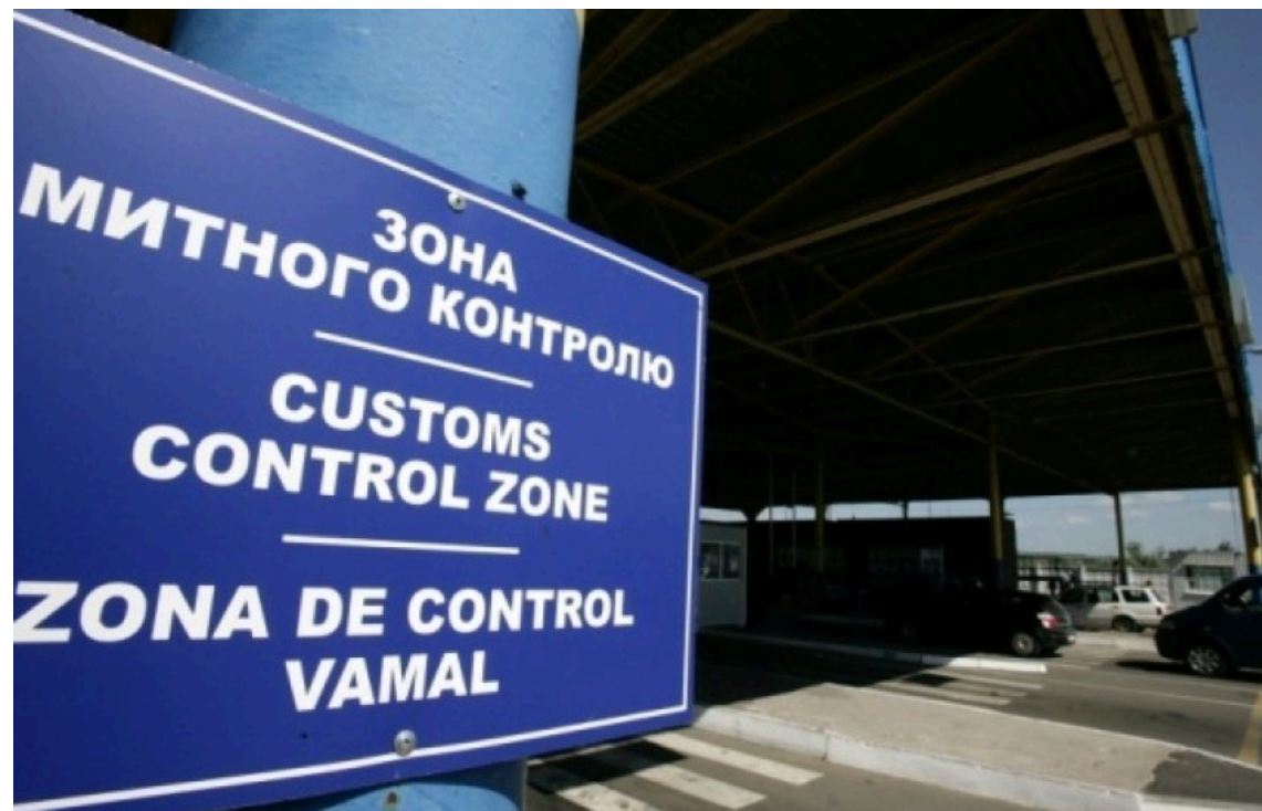
Митниця отримала лише 48% бюджетного запиту

Бюджетний запит Державної митної служби України наразі задоволений лише на 48%. В умовах війни та підготовки України до вступу в ЄС залучення міжнародної технічної й фінансової допомоги є необхідною умовою реалізації митної реформи.