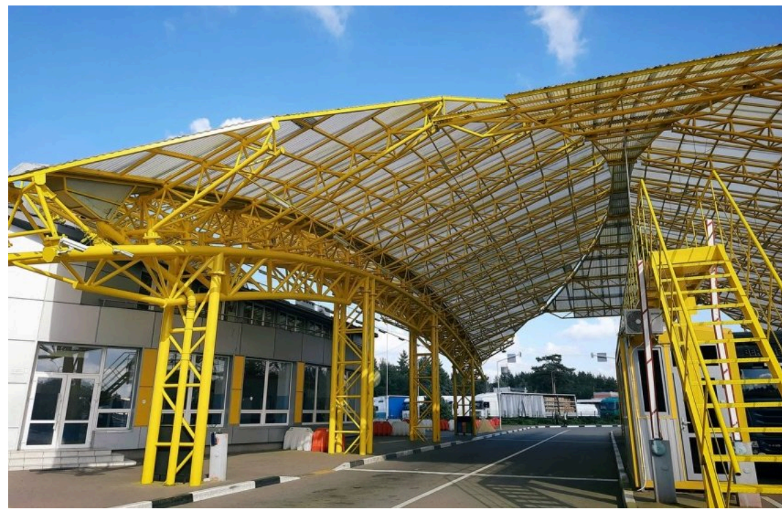
Україна розширює прикордонну інфраструктуру

На Вінниччині триває будівництво міжнародного автомобільного пункту пропуску "Бронниця-Унгурь" на кордоні з Молдовою. Проект передбачає створення сучасної інфраструктури для швидшого та зручнішого перетину кордону і підвищення пропускної спроможності пункту.