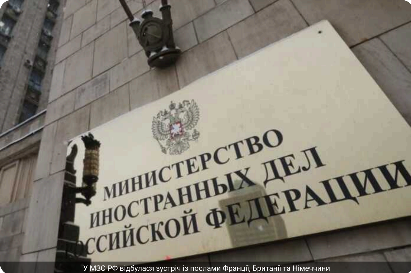
У МЗС РФ відбулася зустріч із послами Франції, Британії та Німеччини

У Міністерстві закордонних справ Росії відбулася зустріч за участі послів Франції, Великої Британії та Німеччини, які прибули для переговорів із заступником глави відомства.