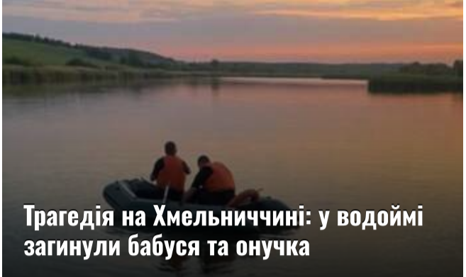
Трагедія на Хмельниччині: у водоймі загинули бабуся та онучка