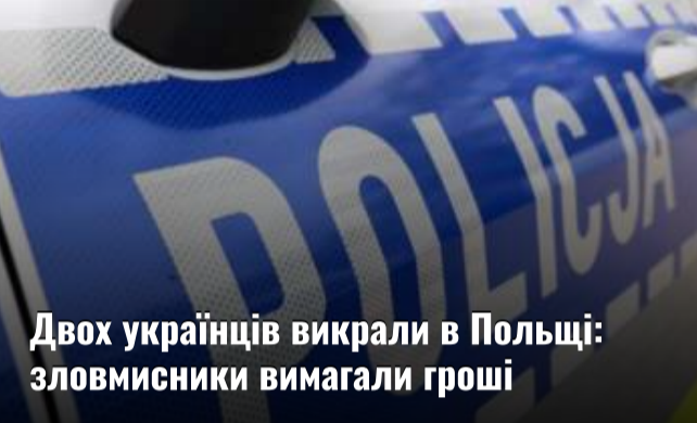
Двох українців викрали в Польщі: зловмисники вимагали гроші