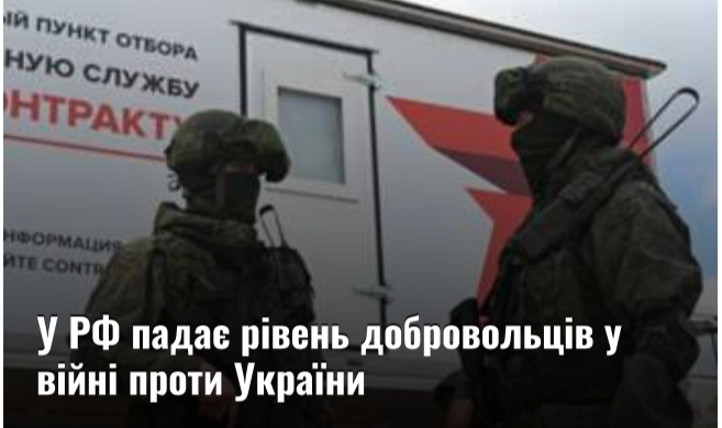
У РФ падає рівень добровольців у війні проти України