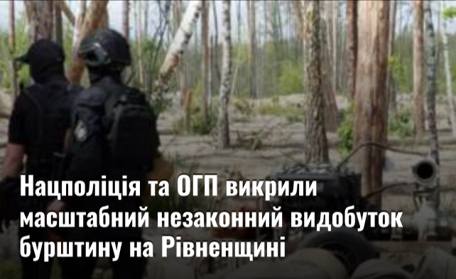
Нацполіція та ОГП викрили масштабний незаконний видобуток бурштину на Рівненщині