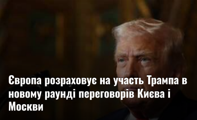
Європа розраховує на участь Трампа в новому раунді переговорів Києва і Москви