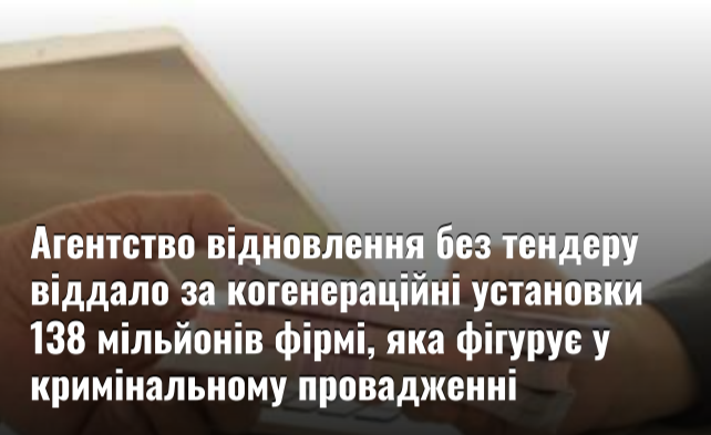
Агентство відновлення без тендеру віддало за когенераційні установки 138 мільйонів фірмі, яка фігурує у кримінальному провадженні