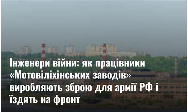
Інженери війни: як працівники «Мотовіліїнських заводів» виробляють зброю для армії РФ і їздять на фронт