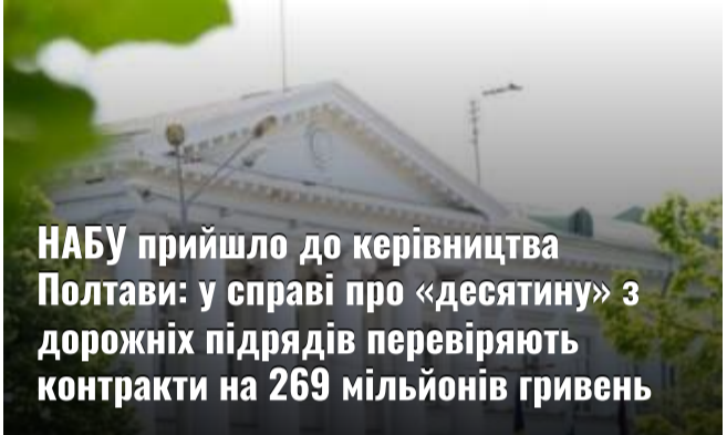
НАБУ прийшло до керівництва Полтави: у справі про «десятину» з дорожніх підрядів перевіряють контракти на 269 мільйонів гривень