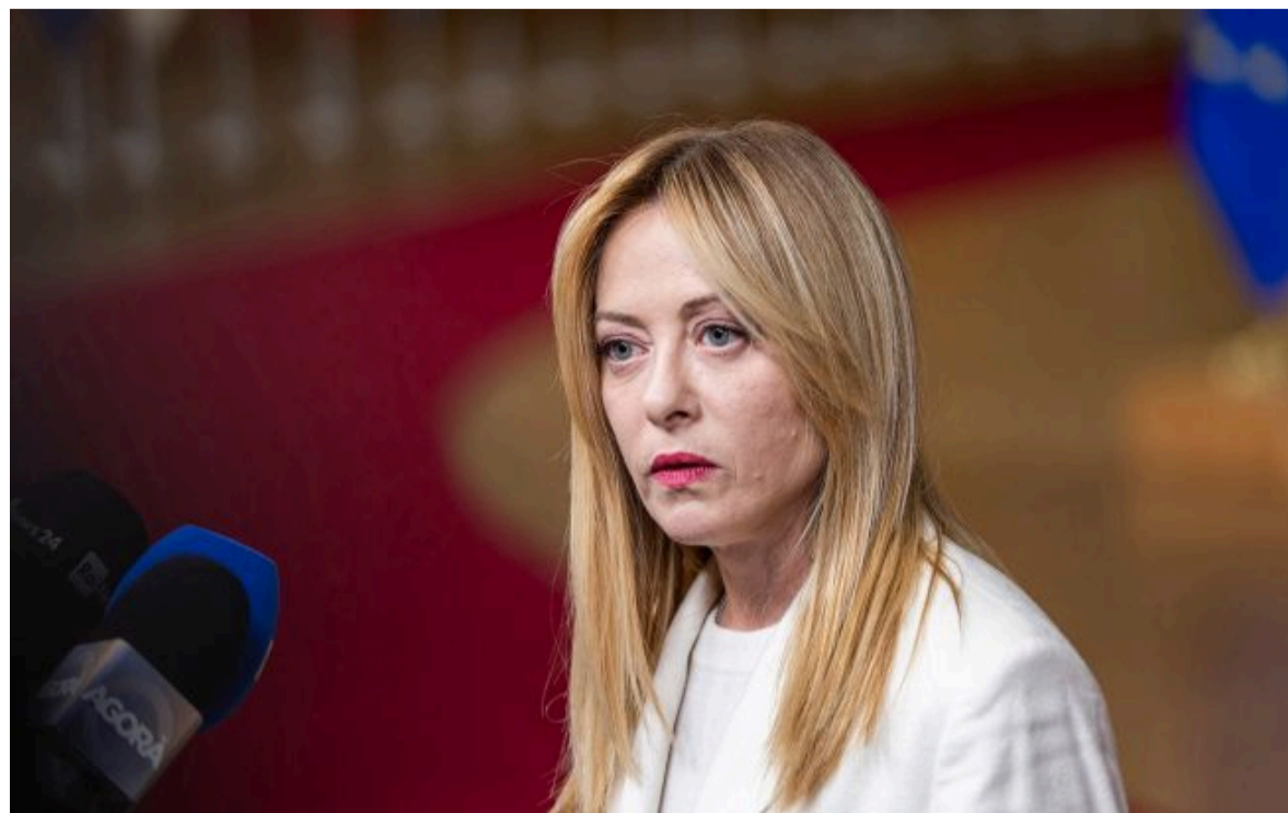
Фото: Джорджа Мелоні (Getty Images)