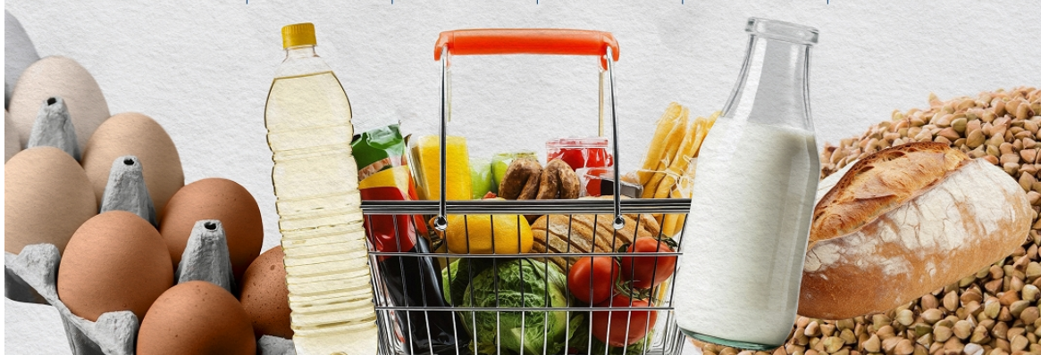
Фото: актуальні ціни (серед найнижчих) на популярні продукти в супермаркетах станом на 11 червня (інфографіка РБК-Україна)