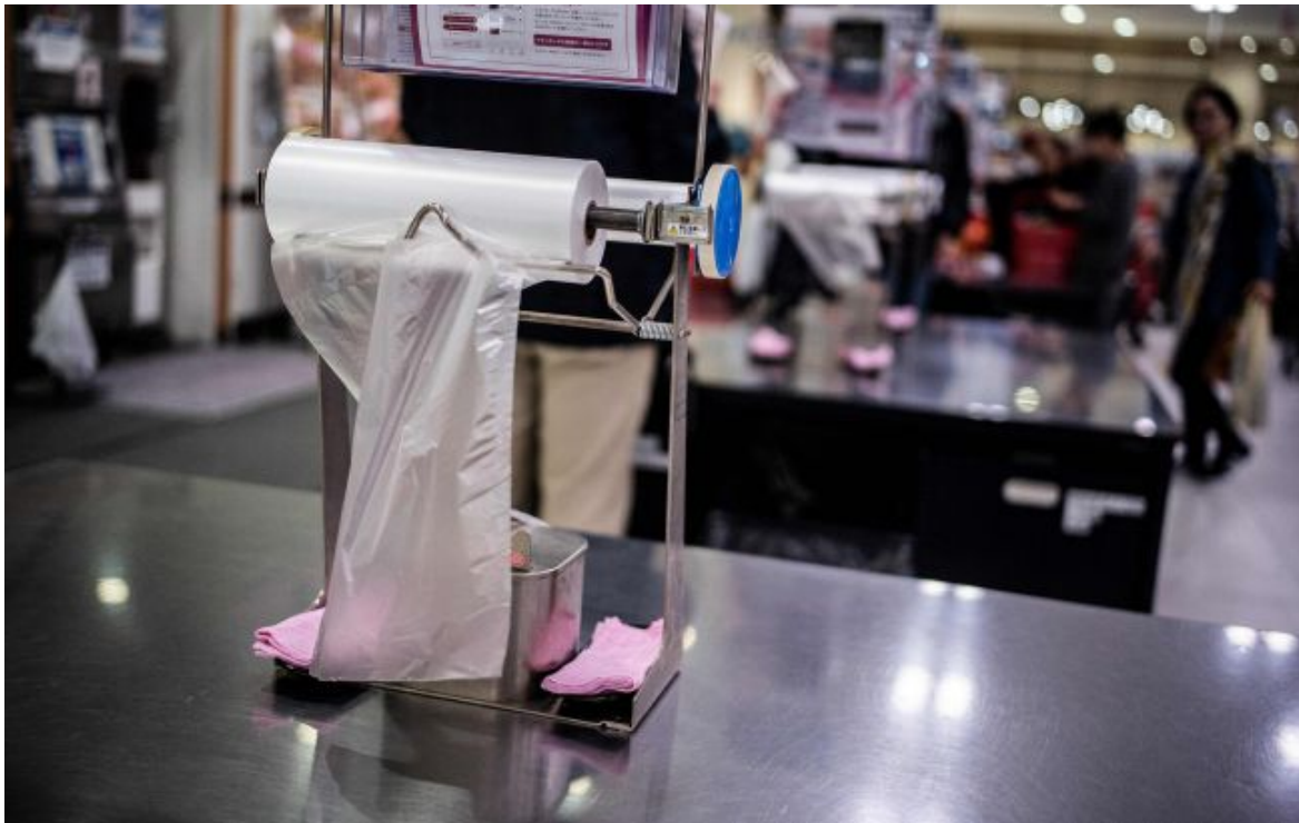
Фото: на продуктивних полицях супермаркетів з'явилися бюджетні пропозиції

Не витрачай час на шум! Читай тільки суть з РБК-Україна у Google