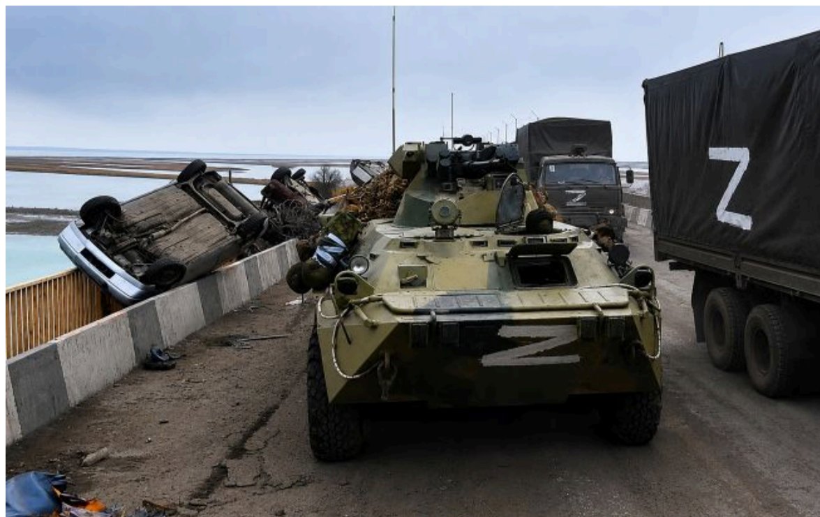
Фото: Чонгарський міст зазнав критичних пошкоджень під час ударів ЗСУ (скрін з відео)