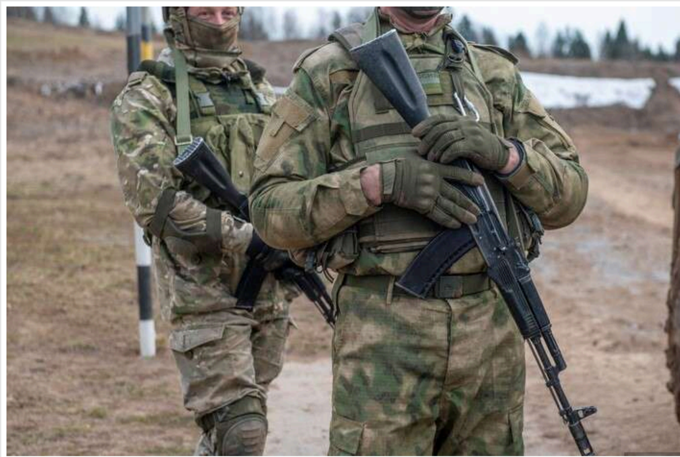
СБУ встановила особи окупантів, які віддали наказ стратити українського військовополоненого

Співробітники Служби безпеки України заочно повідомили про підозру військовослужбовцям РФ, які віддали наказ обезголовити полоненого бійця ЗСУ. Йдеться про двох окупантів, які причетні до масових убивств українських військовополонених на Донеччині.