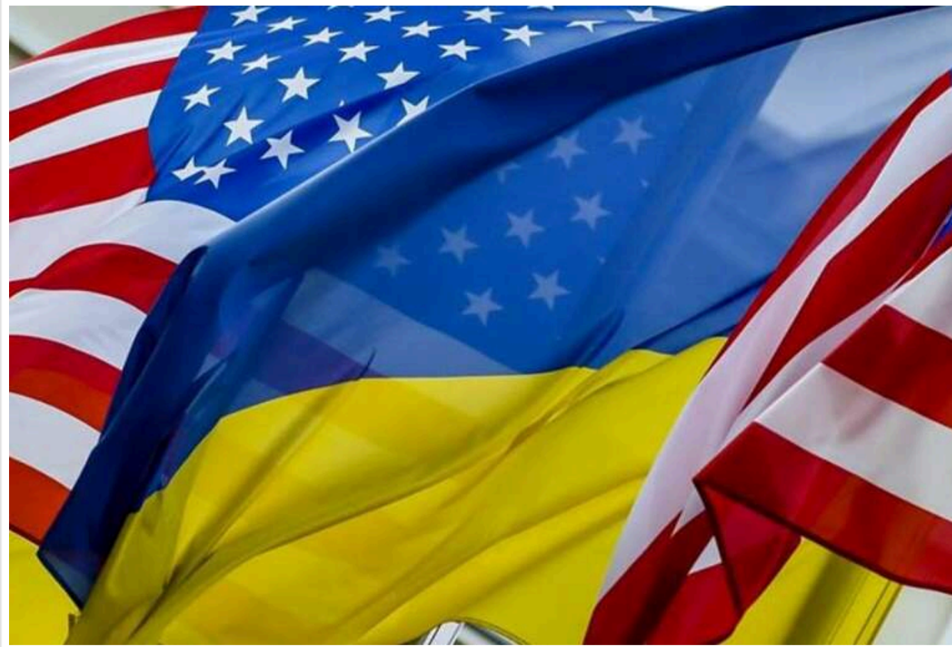
Інвестиційний фонд за угодою про надра: як він працюватиме та які внески зроблять США й Україна

За угодою про надра, США та Україна створюють спільний Інвестиційний фонд, який фінансуватиме розвиток видобутку корисних копалин, нафти та газу, а також сучасну інфраструктуру та перероблення.