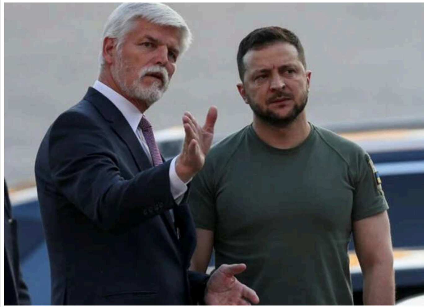
Зеленський може відвідати Чехію з неоголошеним візитом 4 травня – ЗМІ

Президент Чехії Петр Павел у неділю, 4 травня, може провести зустріч із президентом України Володимиром Зеленським, який планує здійснити неоголошений візит.