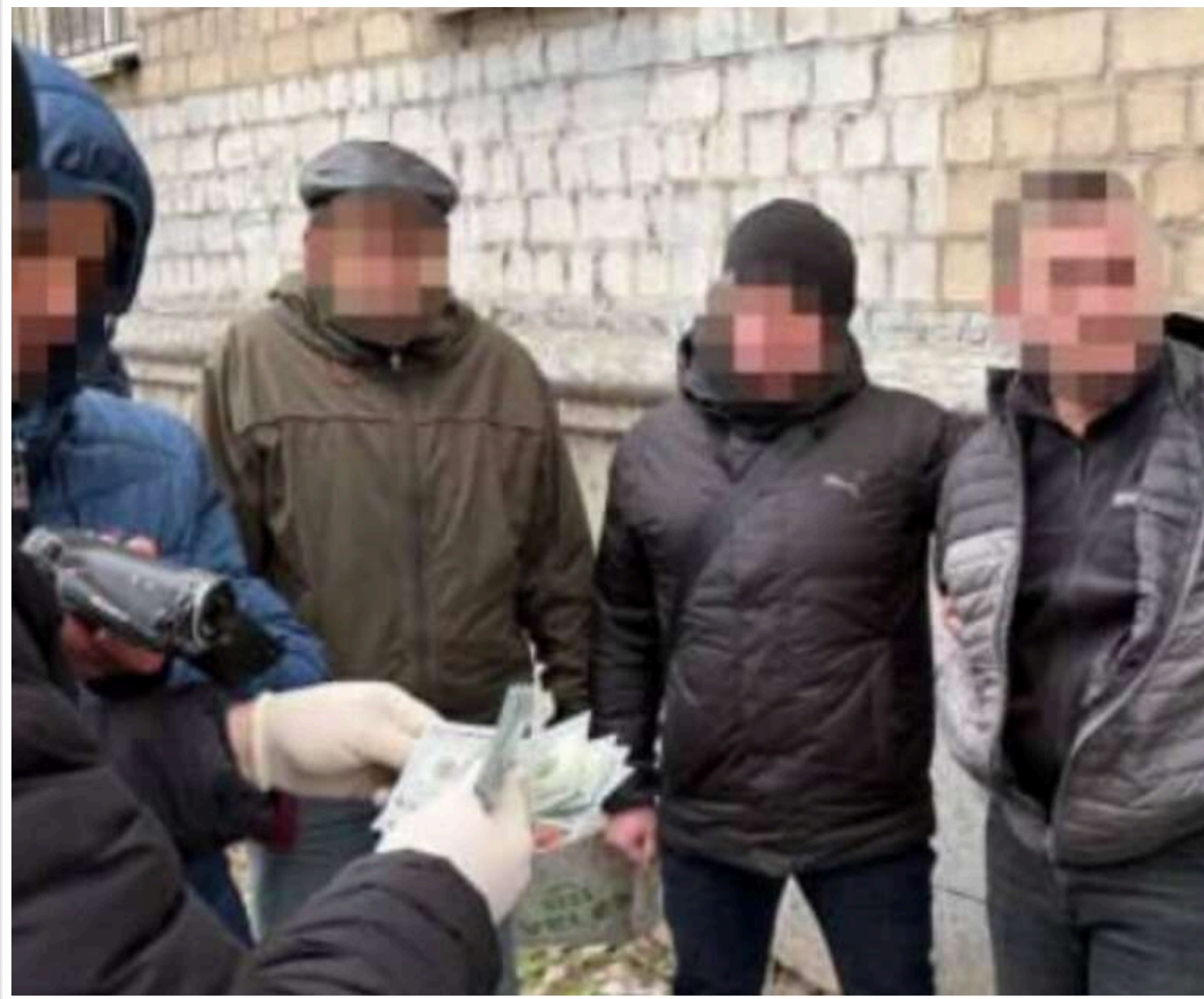
У Дніпрі поліцейський вимагав 1,5 тисячі доларів за зняття з розшуку ухилиянта, – ДБР