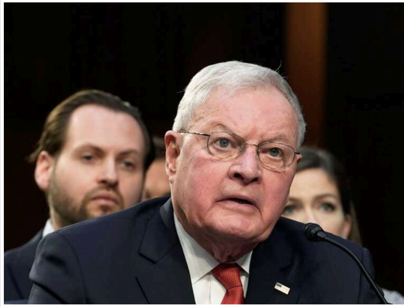
США готові на часткові територіальні поступки Росії в рамках мирного врегулювання війни в Україні, – Кіт Келлог

США готові в межах врегулювання війни в Україні частково погодитися на територіальні вимоги Росії, заявив спецпредставник Трампа Кіт Келлог.