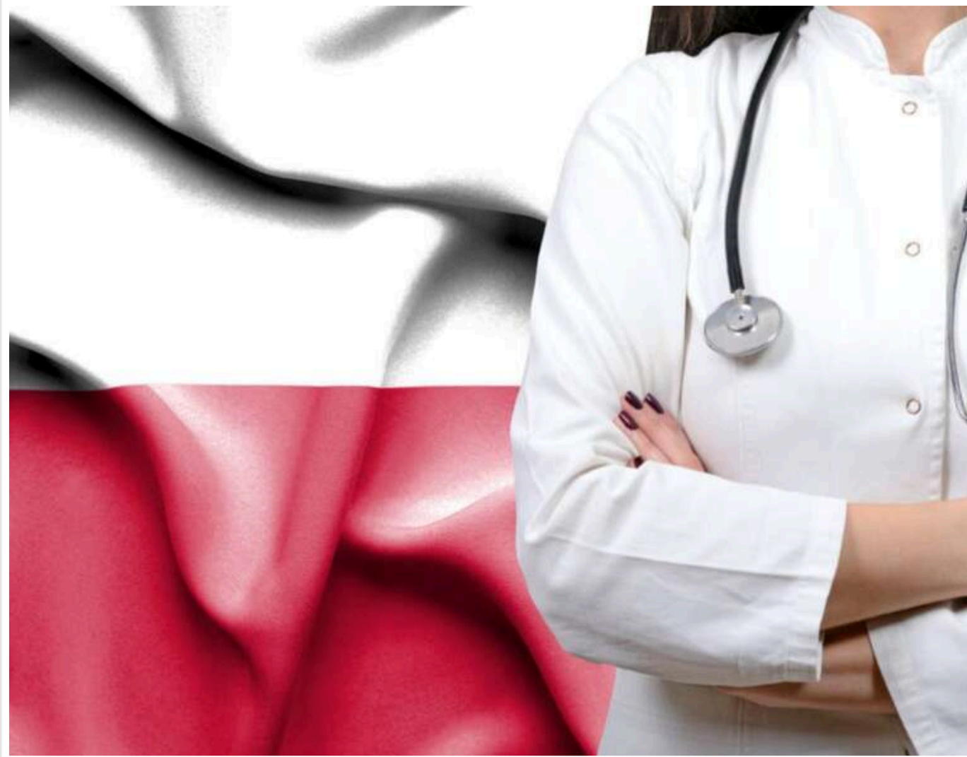
Варшава готується до маршу медиків проти насильства після вбивства лікаря в Кракові