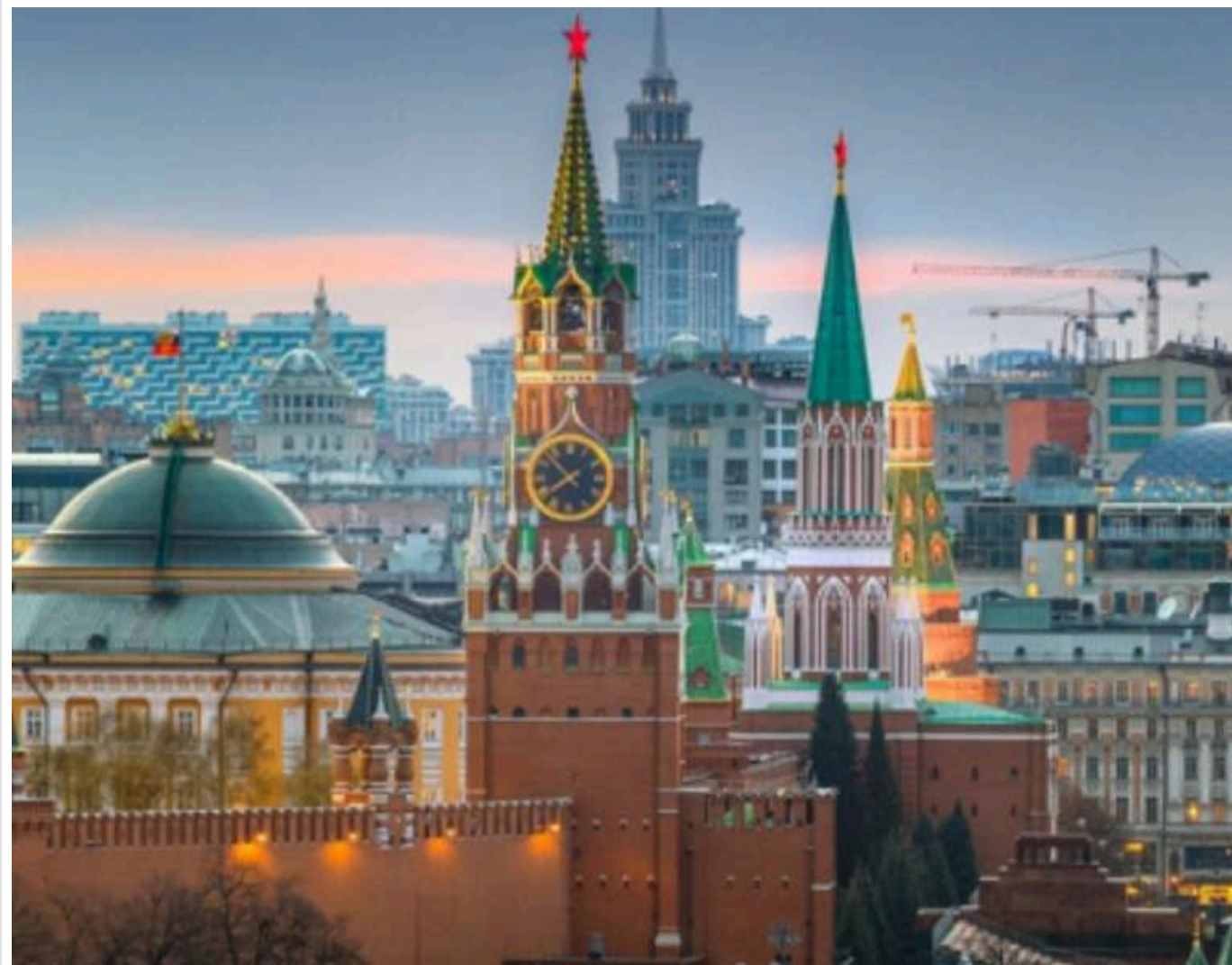
Якщо прибрати політичну складову, удар по Москві під час параду на 9 травня – ідеальна військова мішень, – військовий

Читати на руськом Read in English Додати як бажане джерело в Google