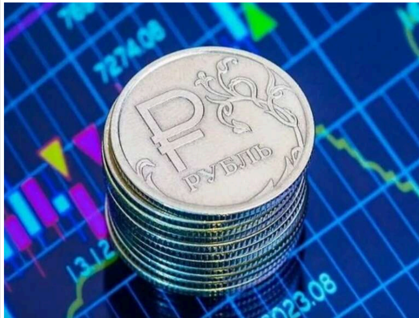
Економіка Росії різко сповільнюється: аналітики фіксують ознаки внутрішньої кризи

Економіка Росії, яка ще нещодавно демонструвала ознаки стабільності, стрімко втрачає свої позиції під впливом внутрішніх та зовнішніх факторів. Високочастотний індекс Goldman Sachs свідчить про різке уповільнення річного економічного зростання Росії з приблизно 5% наприкінці минулого року до майже нульової позначки.