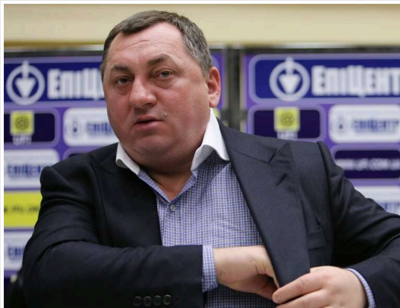
Майбах за 12 мільйонів: депутат і власник «Епіцентру» Олександр Герєга засвітився на елітному Mercedes-Maybach GLS

Народний депутат та співвласник торгової імперії «Епіцентр» Олександр Герєга став героєм обговорень у соцмережах після появи фото його люксового позашляховика Mercedes-Maybach GLS-Class.