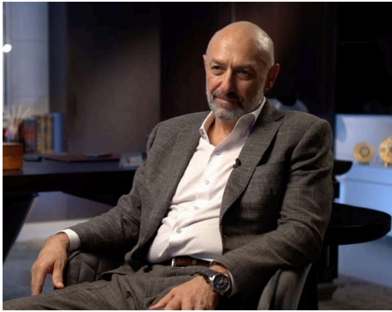
Суд залишив чинною санкцію на арешт олігарха-втікача Боголюбова

Київський апеляційний суд підтвердив рішення про арешт олігарха Геннадія Боголюбова, який переховується від правосуддя.