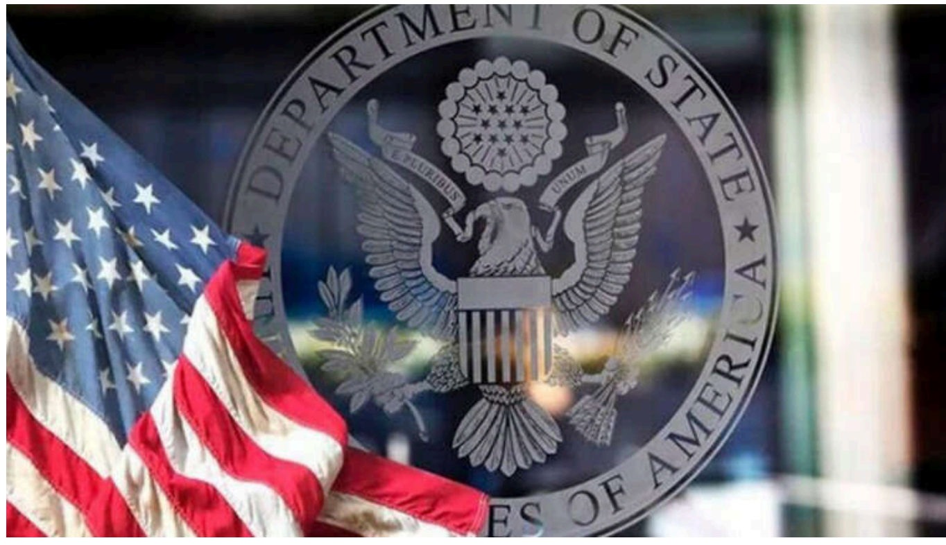
Наступні кілька днів будуть вирішальними для миру в Україні, - Держдеп США

Держдеп США повідомив, що найближчі дні можуть бути вирішальними для миру в Україні. Вашингтон чекає дій з боку російського лідера Володимира Путіна.