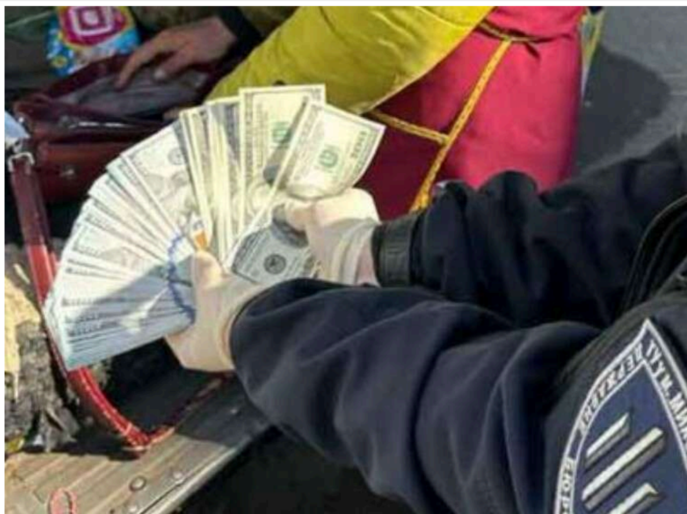
«Квиток» з армії за 16 тисяч доларів: чиновника Міноборони спіймали на схемі ухилення від мобілізації

Читати на руском Read in English Додати як бажане джерело в Google