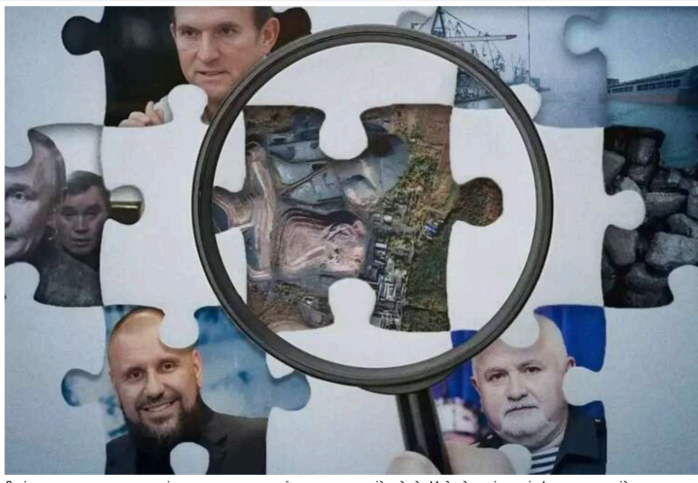
Росія незаконно експортує вугілля з окупованих українських шахт: слід веде до Медведчука і портів Алжиру, - розслідування

Читати на руськом Read in English Додати як бажане джерело в Google