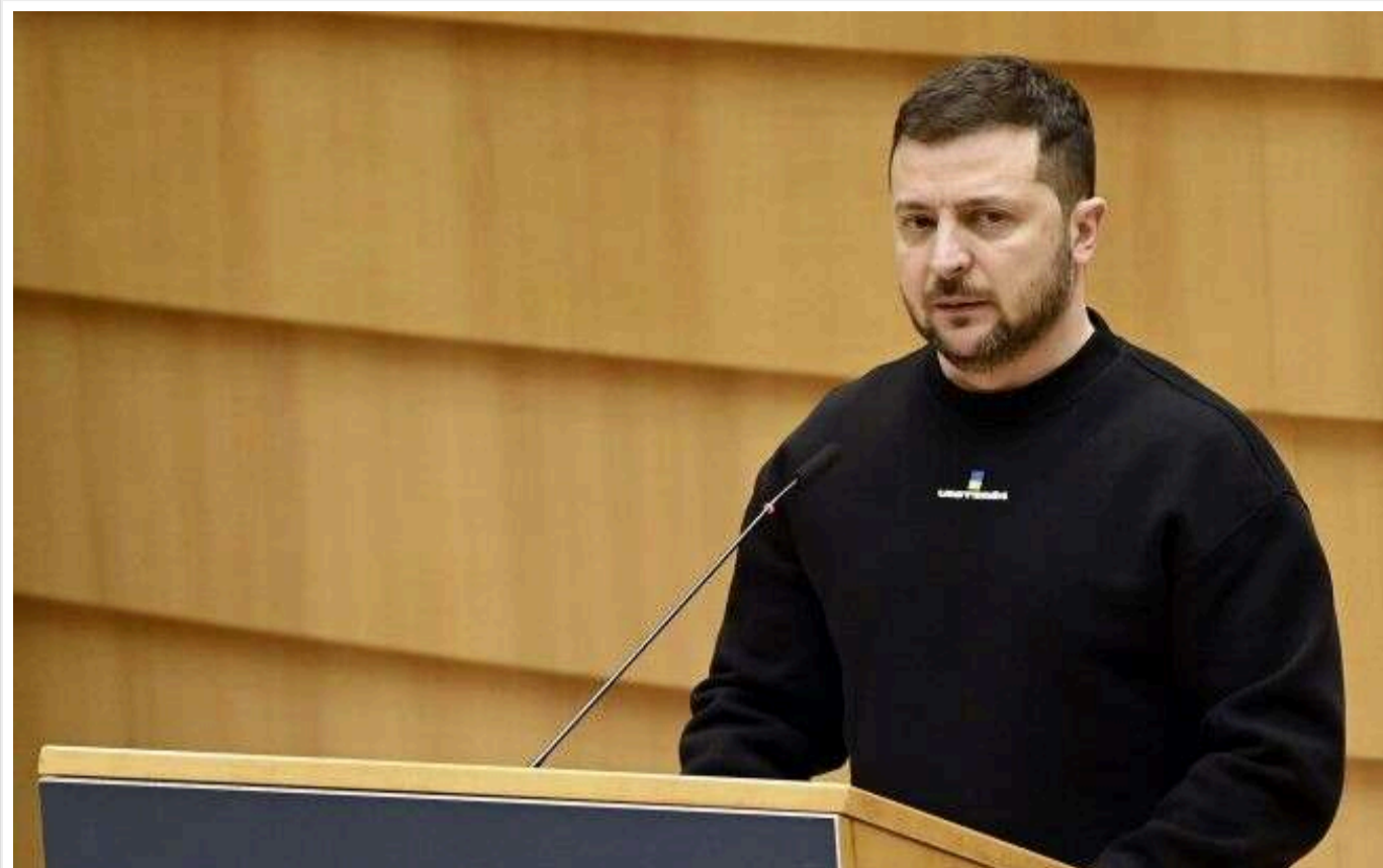
The Economist: Зеленський у Ватикані переконував Трампа не виходити з мирного процесу і заявив про готовність до припинення вогню

Під час короткої зустрічі з Трампом у Римі Зеленський переконував його не виходити з мирного процесу і запевняє у готовності до беззастережного припинення вогню, повідомляє The Economist з посиланням на українські джерела.