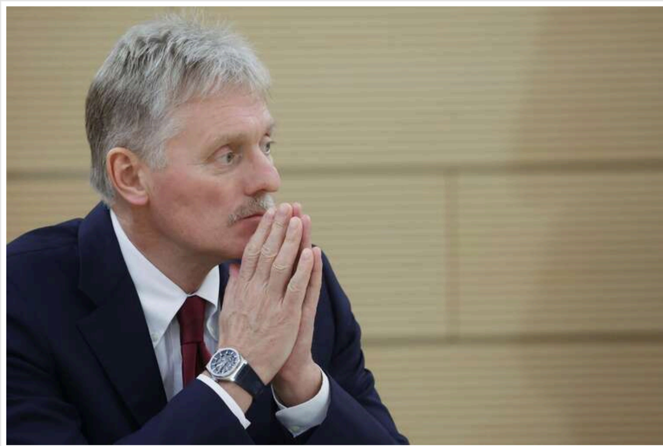
Не можна вирішити негайно: Песков заявив, що українська криза занадто складна

Українську кризу занадто складно вирішити негайно, – заявив Песков