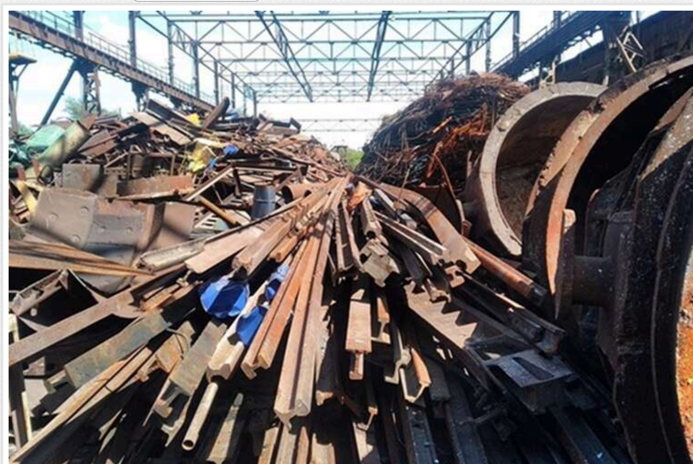
48 країн світу вже обмежили експорт брухту

Читати на русском Додати як бажане джерело в Google