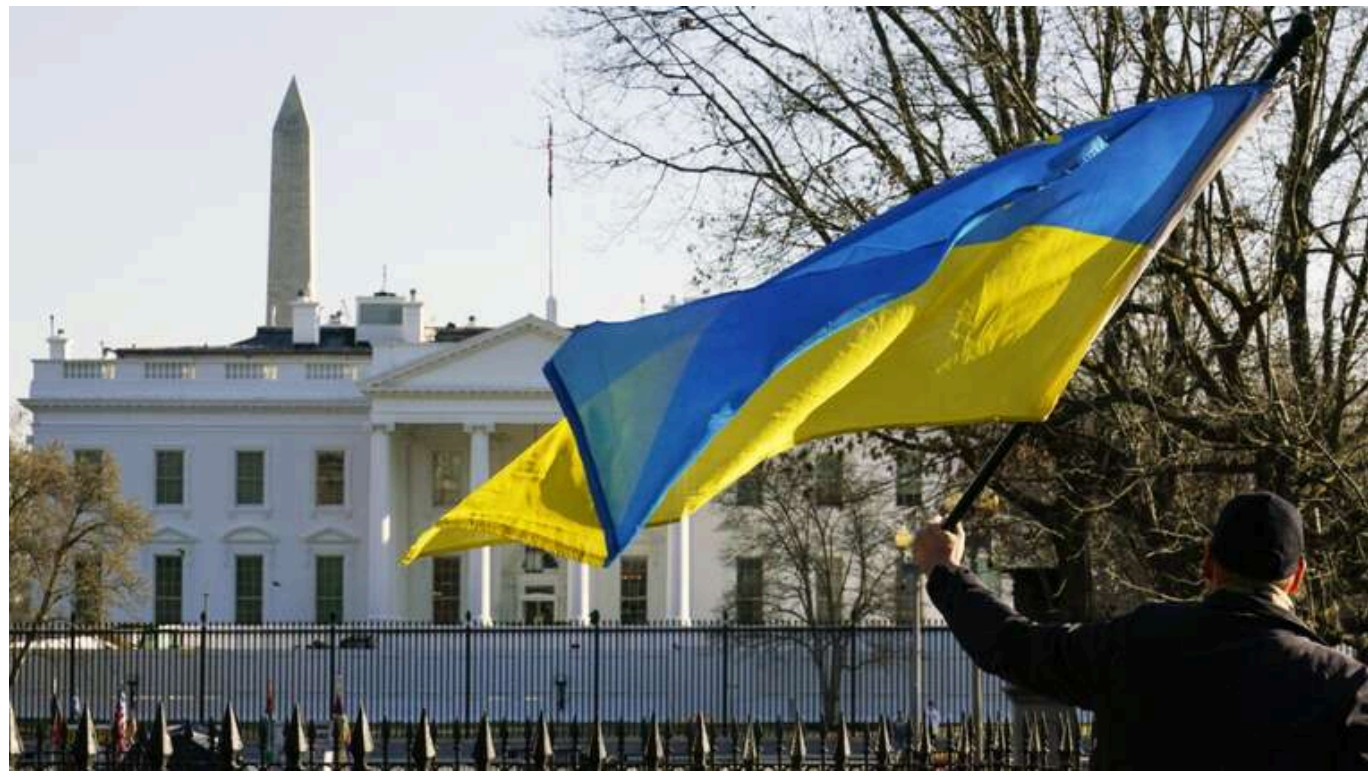
Bloomberg: Україна готова підписати зі США угоду про корисні копалини вже сьогодні

Україна та США можуть підписати угоду про видобуток корисних копалин вже сьогодні, 30 квітня. За неофіційними даними, проєкт угоди, який передбачає створення спільного фонду для управління інвестиційними проєктами України, вже доопрацьовано. Однак, окрім нього, очікується підписання ще двох технічних договорів, які детально визначають правила роботи фонду. Ці документи вже готові.