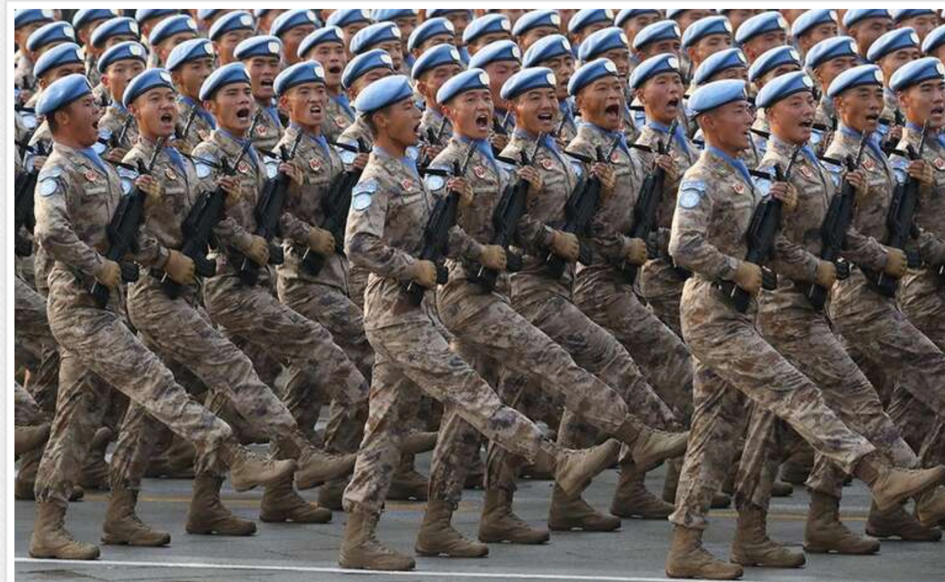
Китаєць, який воює за РФ, закликав не їхати на війну в Україну

Читати на руском Додати як бажане джерело в Google