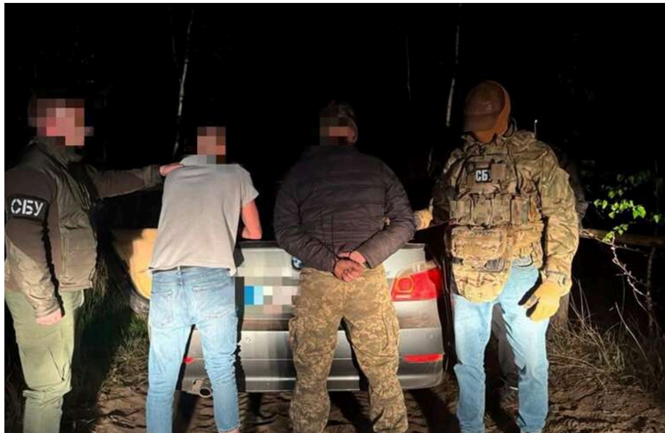
На Рівненщині СБУ викрила нову схему втечі від мобілізації за 13,5 тисячі доларів: затримано двох організаторів

Читати на руском Read in English Додати як бажане джерело в Google