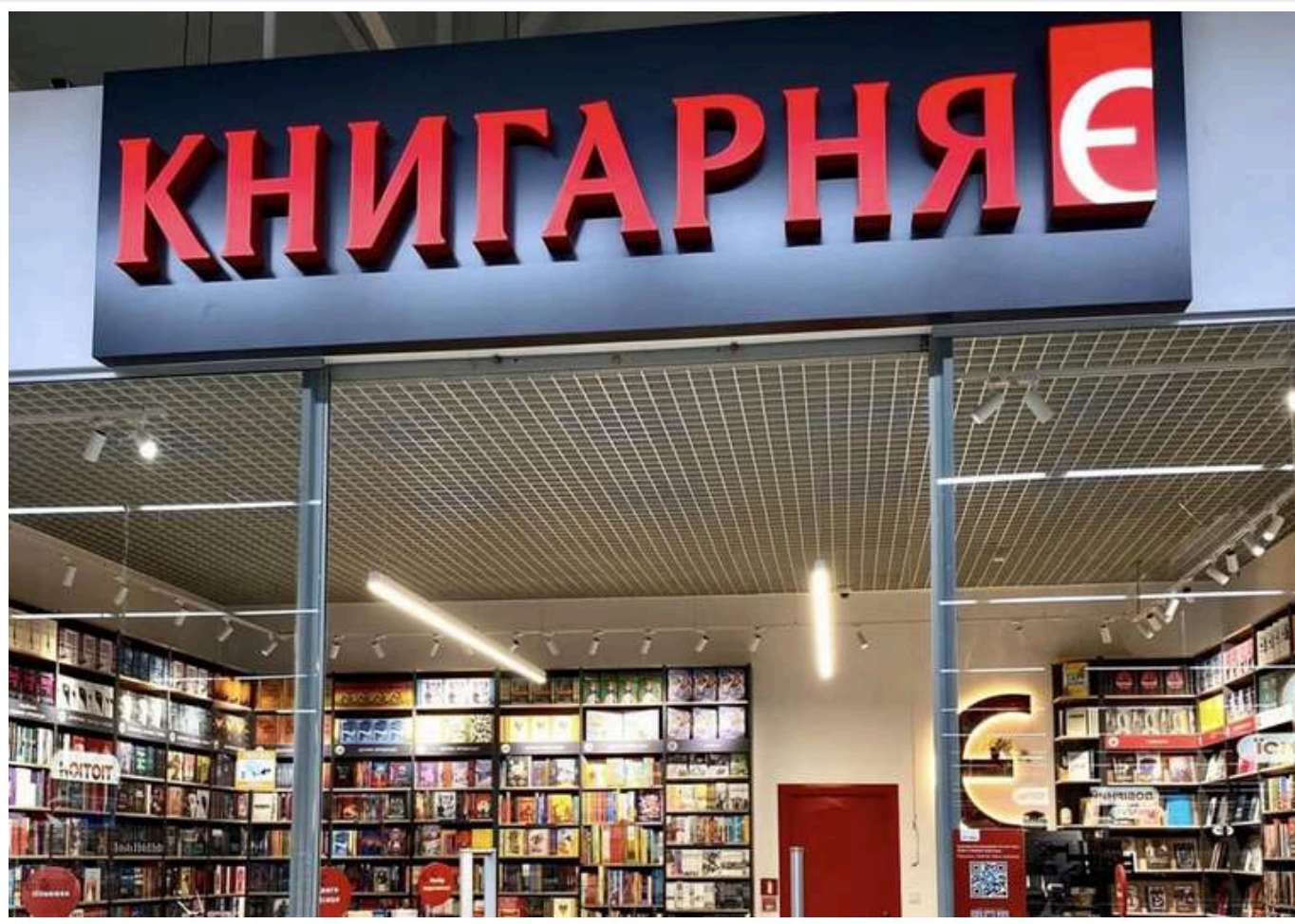
Книгарня «Є» розірвала співпрацю з видавництвом «Кредо» після розслідування про зв'язки з Росією