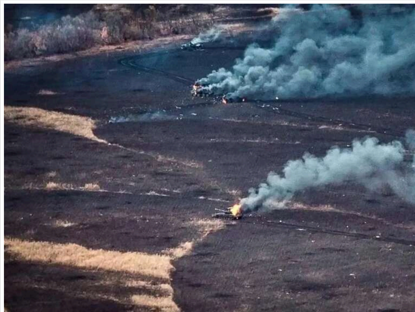
Втрати ворога за добу: ЗСУ відмінували 1100 окупантів, танк та 11 артсистем

Читати на руськом Read in English Додати як бажане джерело в Google