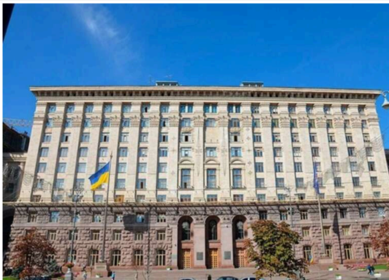
Після скандальної п'яної вечірки в КМДА звільнять керівницю управління

Яскраве святкування відбулося ще 2022 року, але з того часу хтось притримував відео, а вирішили його показати, ймовірно, саме після аналогічного скандалу з вечіркою керівництва міста, щоб підкреслити певні тези.