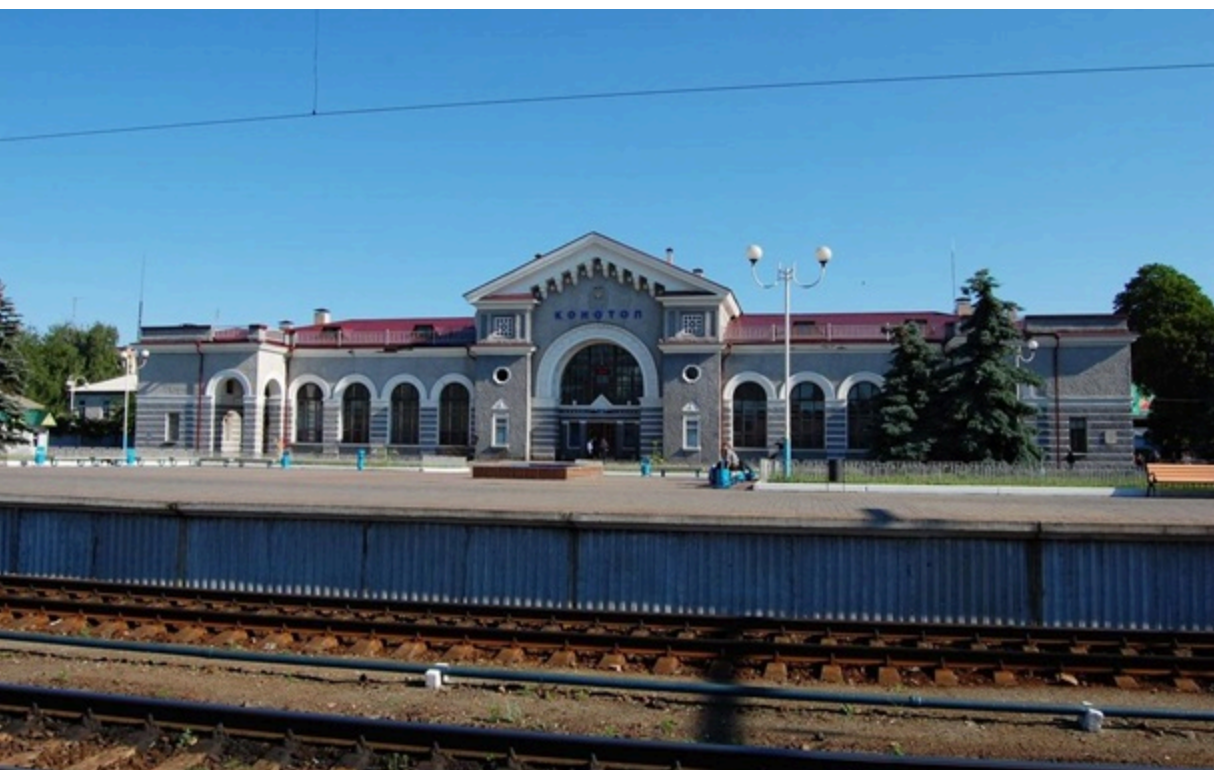
Росіяни атакували залізничну інфраструктуру Конотопа

Унаслідок російського удару загинула працівниця Укрзалізниці, ще четверо залізничників зазнали травм.