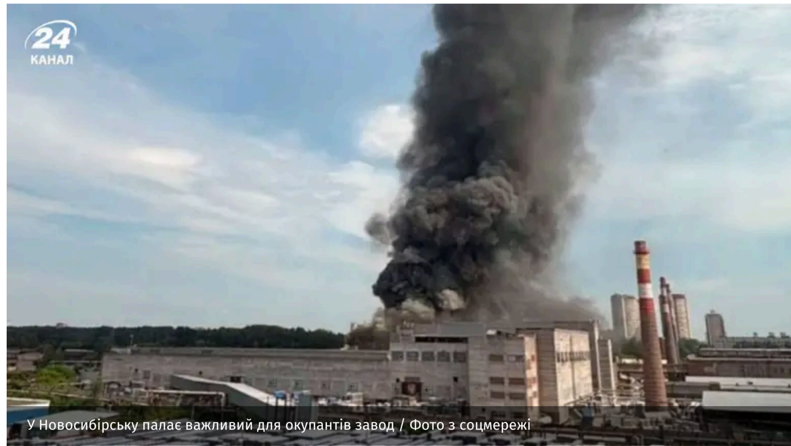
У Новосибірську палає важливий для окупантів завод

11 червня у Новосибірську на території колишнього заводу "Екран" спалахнула пожежа. Сьогодні там розташоване підприємство, що випускає компоненти для зброї та військової техніки.