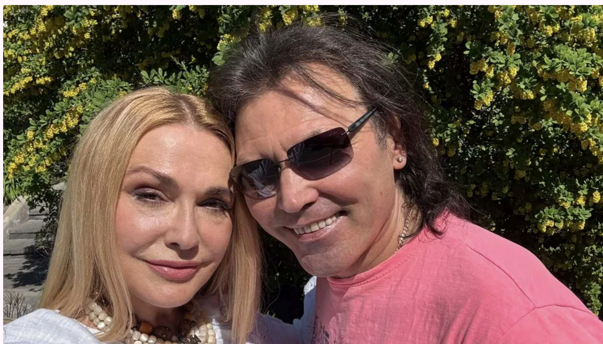
Сумська: У нас окремі спальні

Українська акторка Ольга Сумська не спить разом зі своїм чоловіком, українським артистом Віталієм Борисюком. Про це вона розповіла в коментарі "РБК-Україна". Відео опубліковане 10 червня в YouTube.