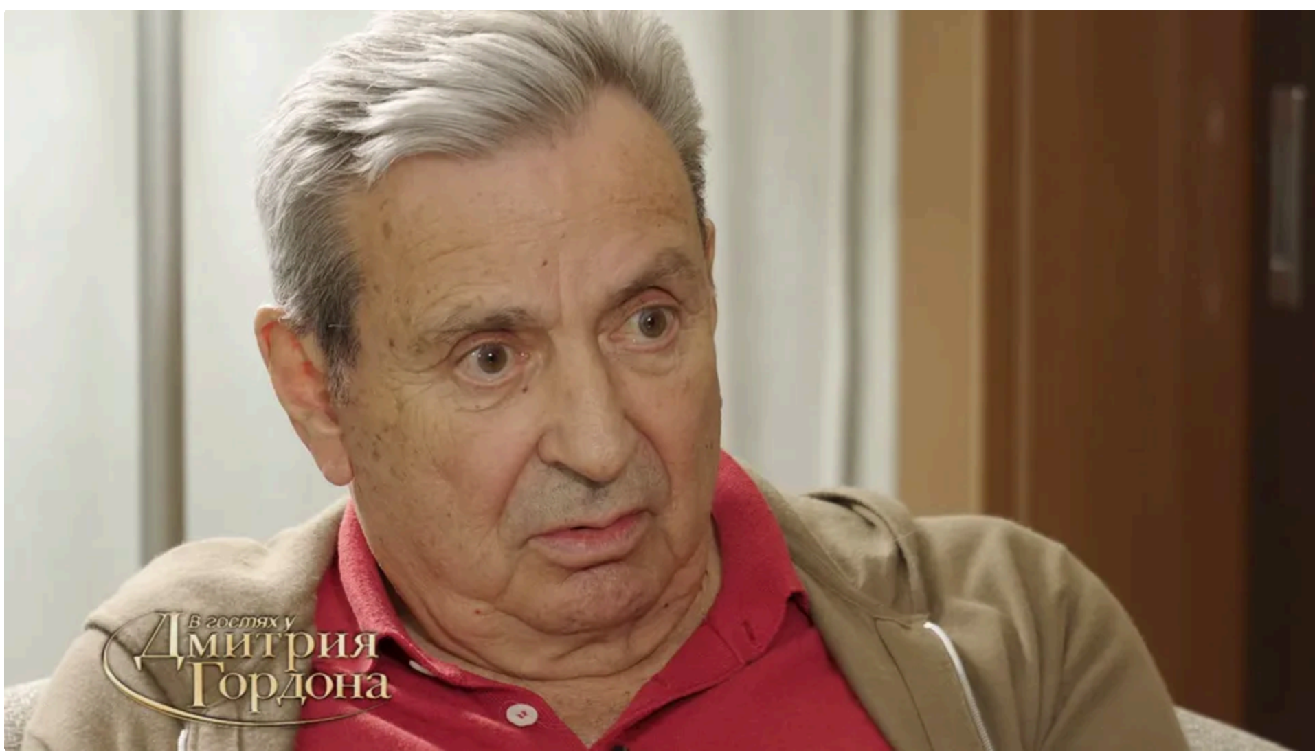
Чигиринський розповів про роль Абрамовича у РФ на початку 2000-х

11 червня, 12.58 🗣️ Цей матеріал також можна прочитати на руському