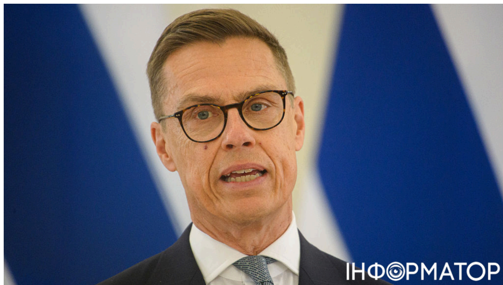
Стубб відмовився бути переговорником Європи з РФ.

Президент Фінляндії Александр Стубб відкинув пропозицію очолити переговори від імені Європи з Росією щодо врегулювання війни в Україні. Раніше фінський лідер закликав ЄС самостійно ініціювати дипломатичний діалог з російським диктатором Володимиром Путіним і запропонував Європі взяти переговорну ініціативу у свої руки.