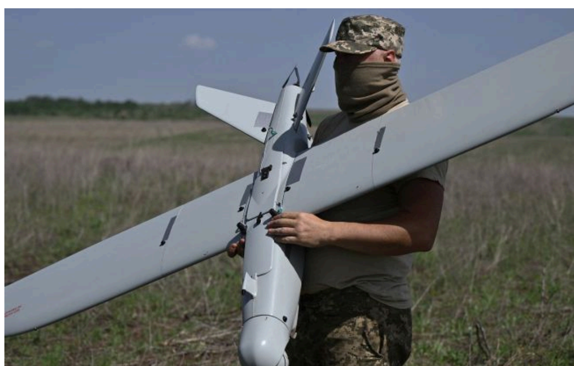
Фото: українські дрони нищать ворожу логістику