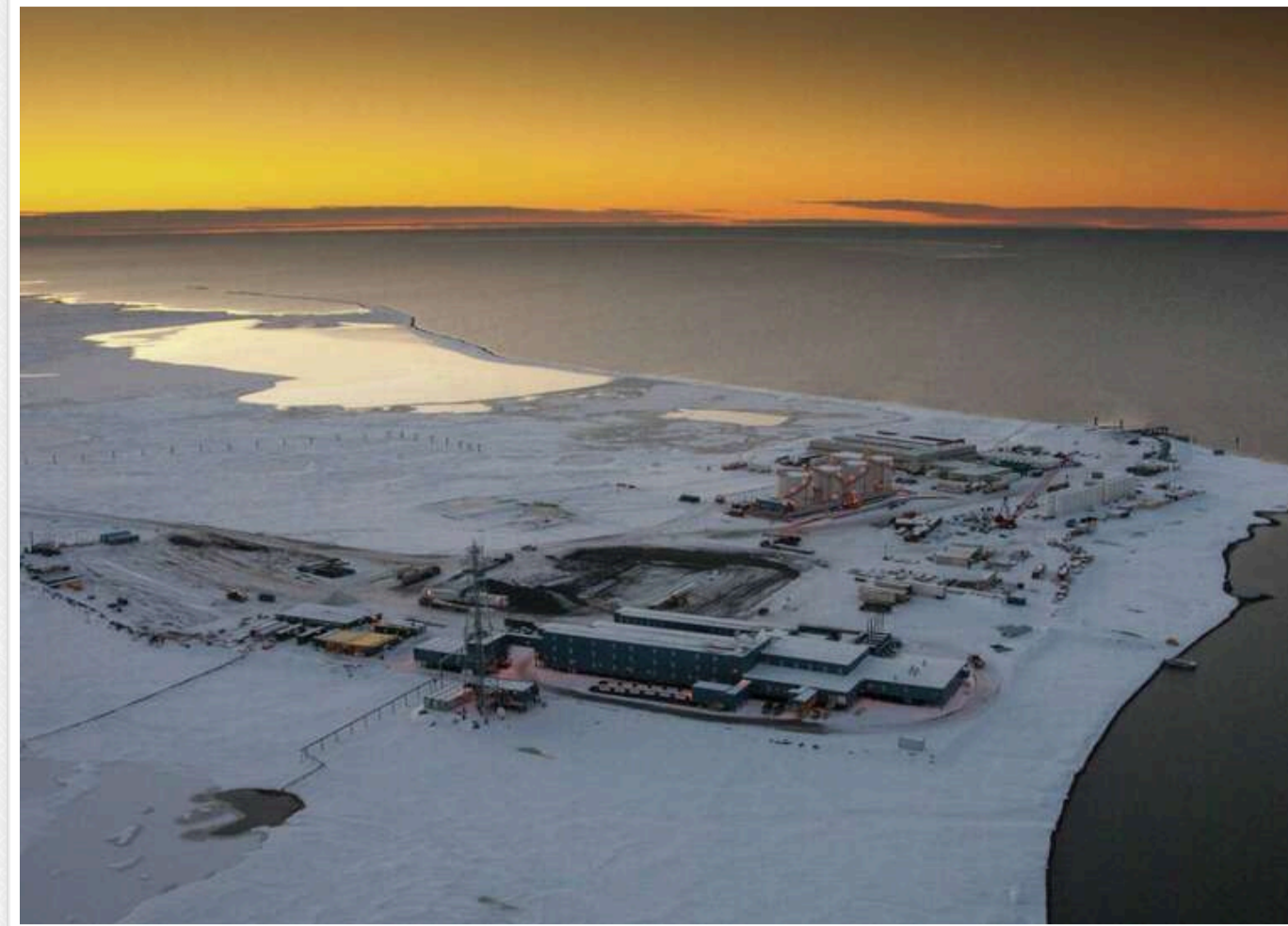
Вашингтон чинить тиск на Японію, Південну Корею та Тайвань, щоб вони вклали кошти у СПГ-проект на Алясці

Адміністрація Дональда Трампа посилює тиск на азійських союзників, вимагаючи участі в великому проєкті СПГ на Алясці, вартістю 44 млрд доларів.