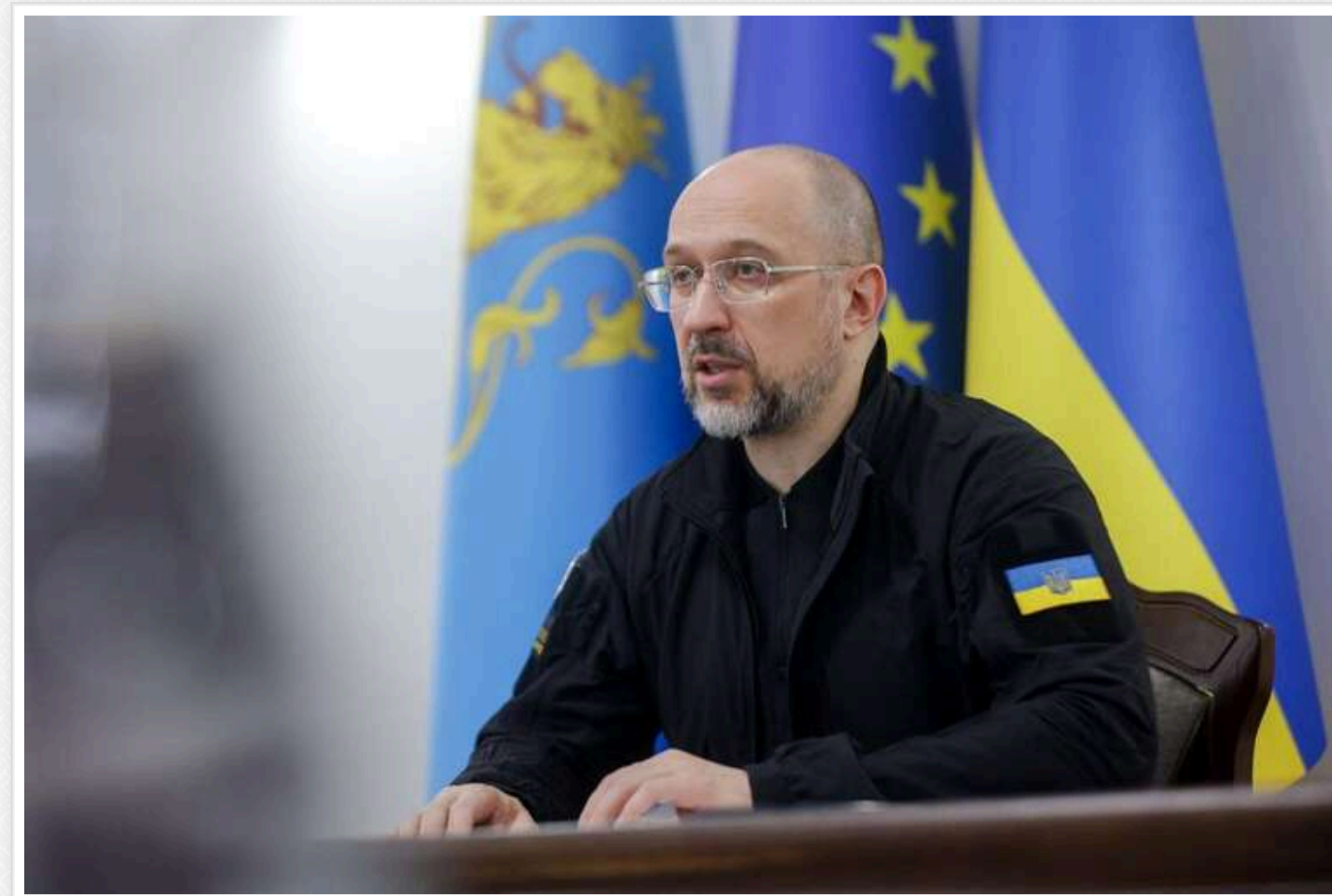
Допомога США до підписання угоди про копалини не буде врахована, - Шмигаль

Допомога, яку Сполучені Штати надали Україні до підписання угоди про використання українських копалин, не буде зарахована у рамках нових домовленостей.