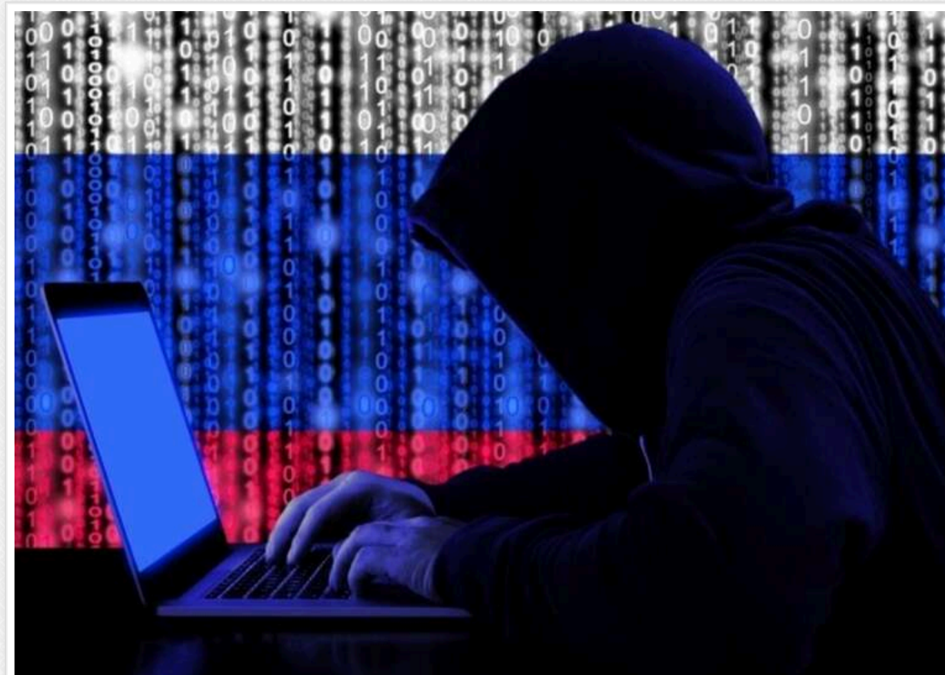
Україна стала більш уразливою до кібератак Росії через скорочення допомоги США, – Bloomberg