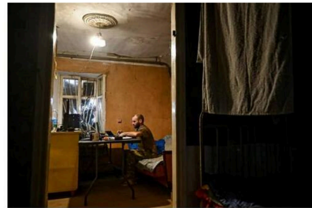
American cybersecurity assistance has included specialist support, training, equipment and software to organizations across Ukraine.

American cybersecurity assistance has been crucial to helping war-torn country fend off hacks, experts say.