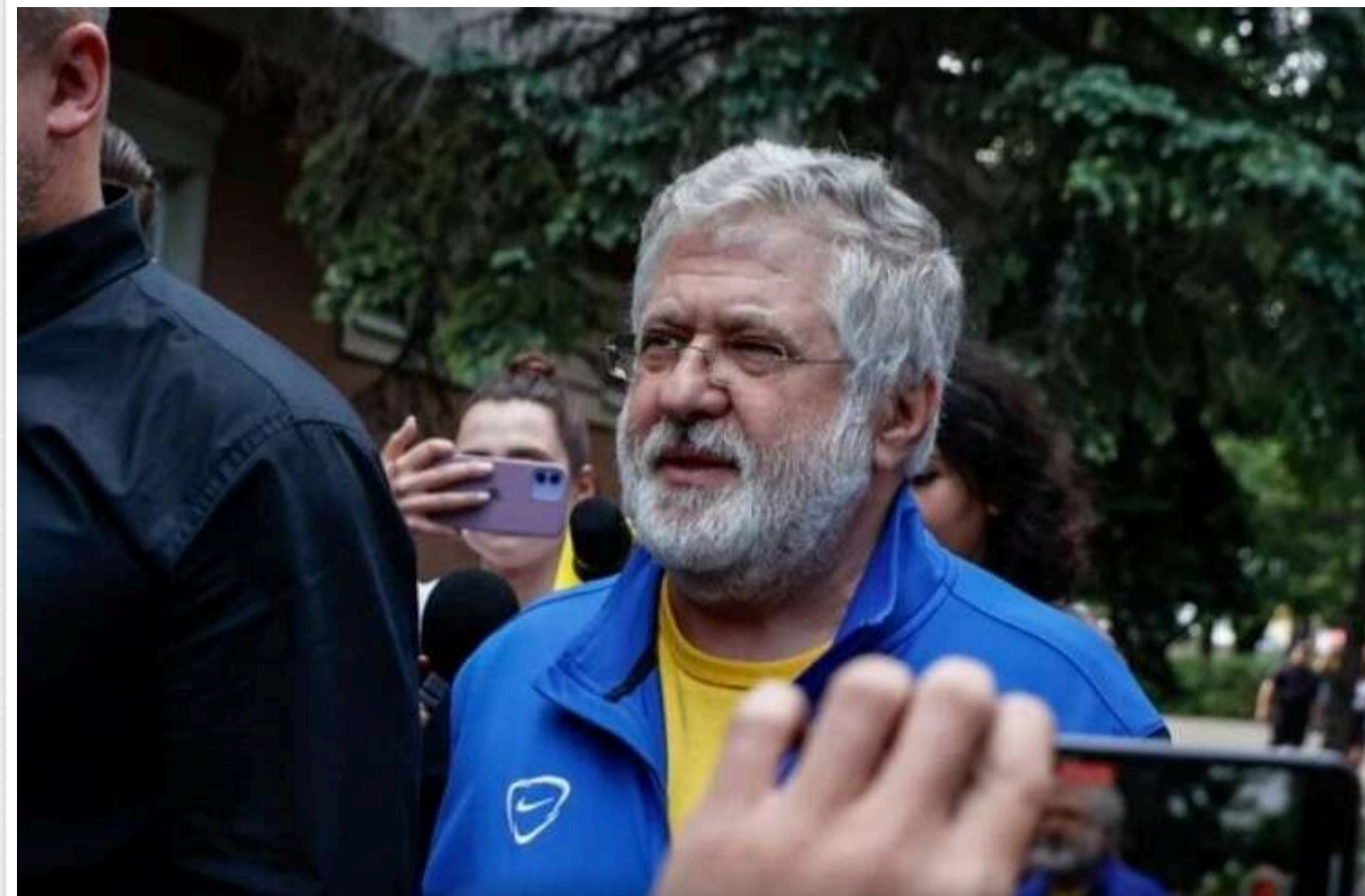
Верховний суд підтвердив законність позбавлення Ігоря Коломойського громадянства України

Читати на руском Read in English Додати як бажане джерело в Google